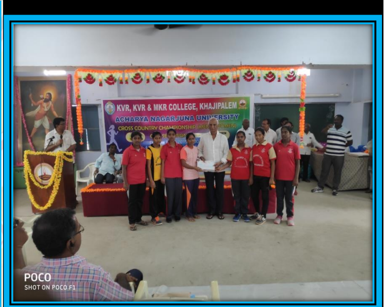
POCO SHOT ON POCO F1