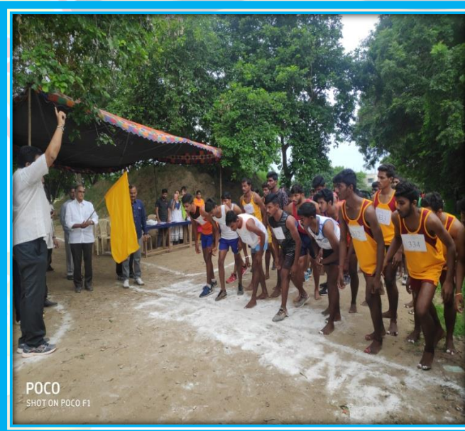
POCO SHOT ON POCO F1